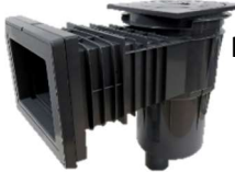
Pumpenschacht 1x1m mit Skimmer ca.200€